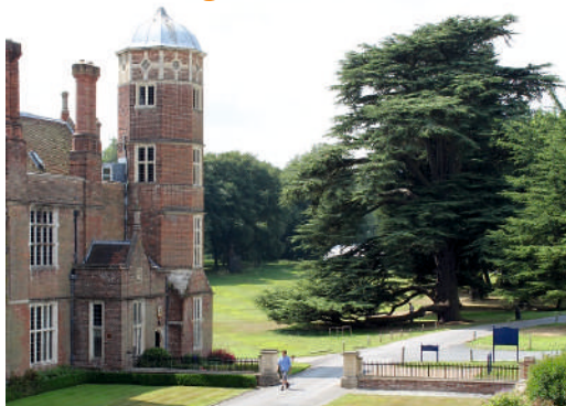
Sample Programme (Cobham Hall)